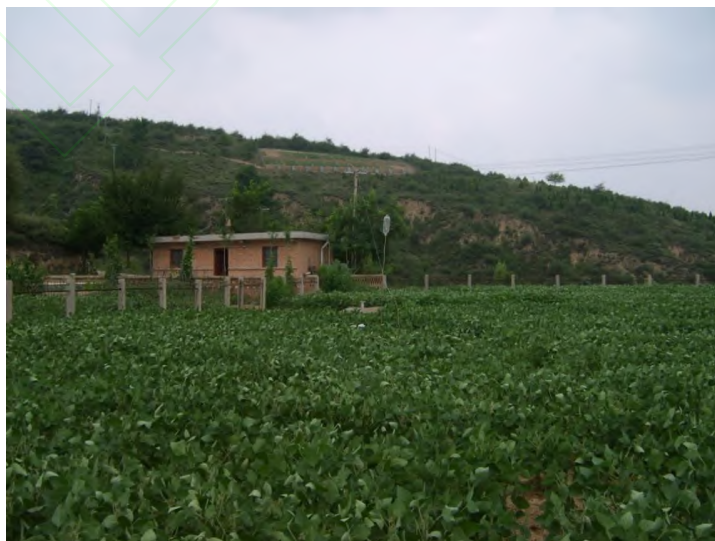
图 1 安塞站山地梯田辅助观测场

山地辅助观测场（ASAFZ03ABC_01）是安塞站长期定位监测样地，为黄土高原丘陵沟壑区典型农田耕作类型的山地梯田（图 1），土壤为黄绵土，养分比较贫瘠，氮、磷缺乏，钾富足，无灌溉条件，靠天然降水，属雨养农业地区，其代表一年一熟制的黄土丘陵沟壑区旱作农田生态系统。本观测场施肥方式、种植制度、田间耕作管理和土壤类型都有很强的区域代表性，在此基础上研究典型耕作模式以及长期环境变化对土壤肥力、作物产量、农田生态系统作物生长过程的影响。