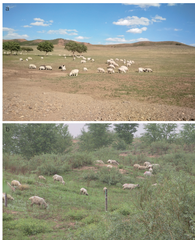
图2 牧压梯度实验（研究放牧压力对半干旱草地的影响，确定合理牧压梯度）

沙漠化不仅造成严重的土壤退化，而且直接导致植被结构和功能破坏。通过研究沙漠化过程中沙区植被在群落、种群、个体、生理等各个层面的响应，发现沙漠化在群落层面上主要表现为物种丰富度、多度以及生产力的下降 [16] ，在种群层面表现为群落优势种群的更替 [17,18] ，在个体层面上表现为植物体内物质和能量分配格局的改变 [19-21] ，在生理层面上表现为细胞内物质含量和生理代谢过程的变化 [22,23] 。相关研究为科学认知固沙乔灌木维持固沙植被群落稳定的重要功能提供理论支持。沙漠化对植物最直接的影响方式是沙埋和风沙流 [24,25] 。沙埋程度和风沙流强度对植物的存活和生长影响较大，但是沙区乡土植物可以通过提高体内抗氧化酶活力、渗透调节物质及净光合速率等来适应沙埋和风沙流 [24-27] 。综合沙漠化过程中植物种群、个体、生理特征的表现，将植物对沙漠化的响应分为敏感型、积极忍耐型、迟钝型3种类型，为风沙区重大生态工程建设的植物种类选择提供理论依据。