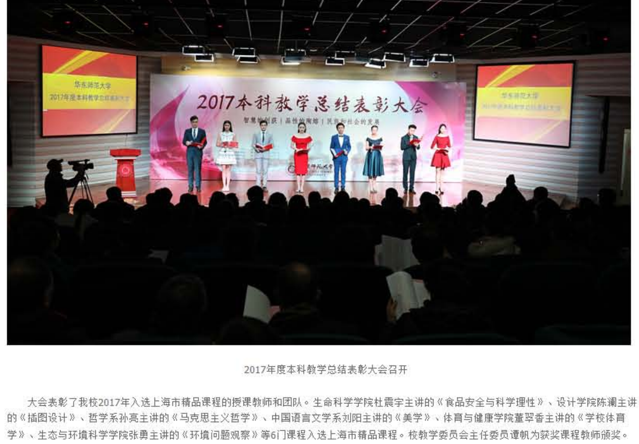
2017年度本科教学总结表彰大会召开

2017年,我校坚持社会主义办学方向,扎根中国大地办一流大学,以“打造一流本科教育,提升人才培养质量”作为各项教育教学工作的出发点和落脚点,以本科教学工作审核评估为契机全面加强内涵建设,以课程思政和书院育人为抓手探索立德树人新路径,以暑期班学期和大学学堂在线教学平台为途径共享优质教学资源,以教师发展中心建设、全新教学体系打造以及通识课程改革为保障提升课堂教学质量,以大类培养和理科菁英班为核心丰富学生成长成才通道。该大会是对我校过去一年本科教育教学改革的全面总结与梳理,既展示了教师的教学热忱,又表达了学生的向学之心,充分体现了以总结促发展,以表彰促成长的办学理念。